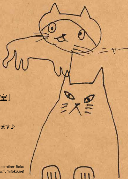
illustration: Raku design: www.fumitoku.net